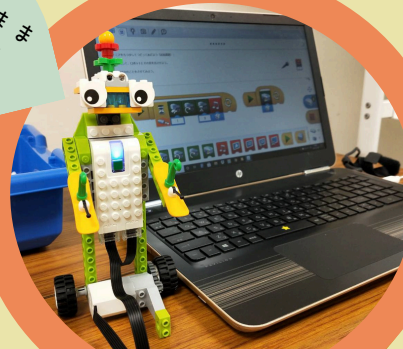
ドキドキづくり隊